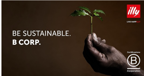
Bild zu Press Release illycaffè wird zur BCorp