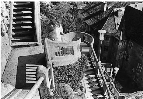
Schlossberg 1982 von Branko Lenart

Credit: Branko Lenart Fotograf: Branko Lenart