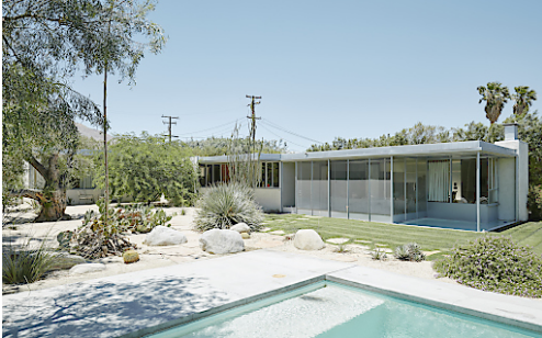
Miller House, Palm Springs, 1936/37