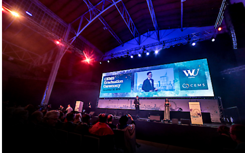
LEDskin-Wall von SIGNATURE bei der 31th CEMS Annual Event & Graduation Ceremony hosted by WU Wien am 30.11.2019