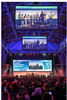
LEDskin-Wall von SIGNATURE bei der 31th CEMS Annual Event & Graduation Ceremony hosted by WU Wien am 30.11.2019