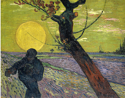
VINCENT VAN GOGH 1853-1890 Sämner bei Sonnenuntergang, 1888 Öl auf Leinwand 73,5 × 93 cm Sammlung Emil Bührle, Zürich

Credit: SIK-ISEA, Zürich (J.-P. Kuhn) Fotograf: SIK-ISEA, Zürich (J.-P. Kuhn)