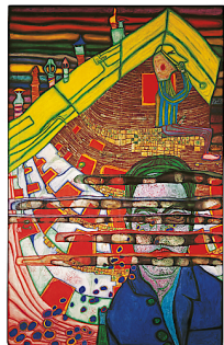
FRIEDENSREICH HUNDERTWASSER 1928-2000 622 Der Nasenbohrer und die Beweinung Egon Schieles, Lugano, 1965 Mixed Media, 116 × 73 cm Die Hundertwasser gemeinnützige Privatstiftung Wien