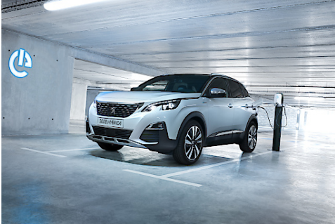
PEUGEOT 3008 GT HYBRID4 mit CO-Bestwert für Plug-In Hybrid Fahrzeuge