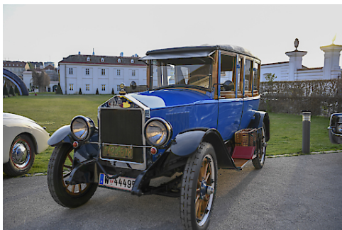
Gewinnerfahrzeug des Concours de Nonchalance im Rahmen der Präsentation des Oldtimer Guide 2019 - DORT Touring Baujahr 1922