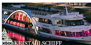
Swarovski Kristallschiff von außen