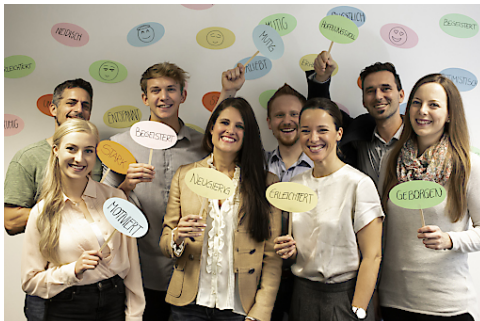
Das Team rund um Instahelp rückt die mentale Gesundheit in den Mittelpunkt.