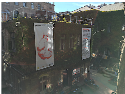
Waves Vienna im Wiener WUK