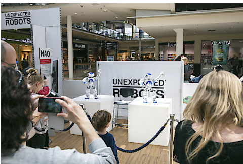
Tanzende Roboter "NAO" im Donau Zentrum