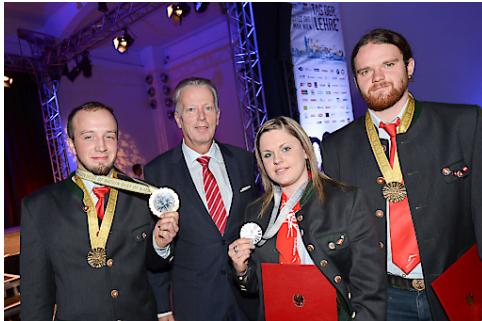
Bundesminister Mitterlehner mit Medaillen-Gewinnern der WorldSkills 2015.