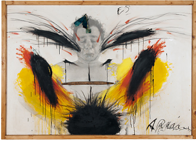
Arnulf Rainer / "ES" / 1970/73 / Ölkreide, Öl auf Foto auf Holz mit Applikationen / ca. 122 x 175 cm.