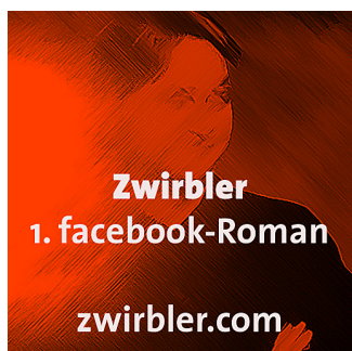
Zwirbler, Hauptfigur des 1. Facebook-Romans