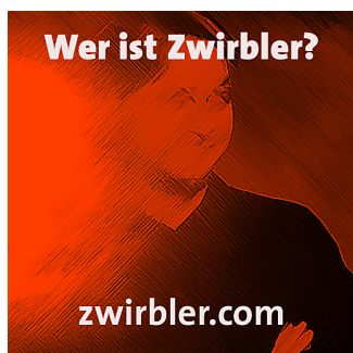
Zwirbler, Hauptfigur des 1. Facebook-Romans